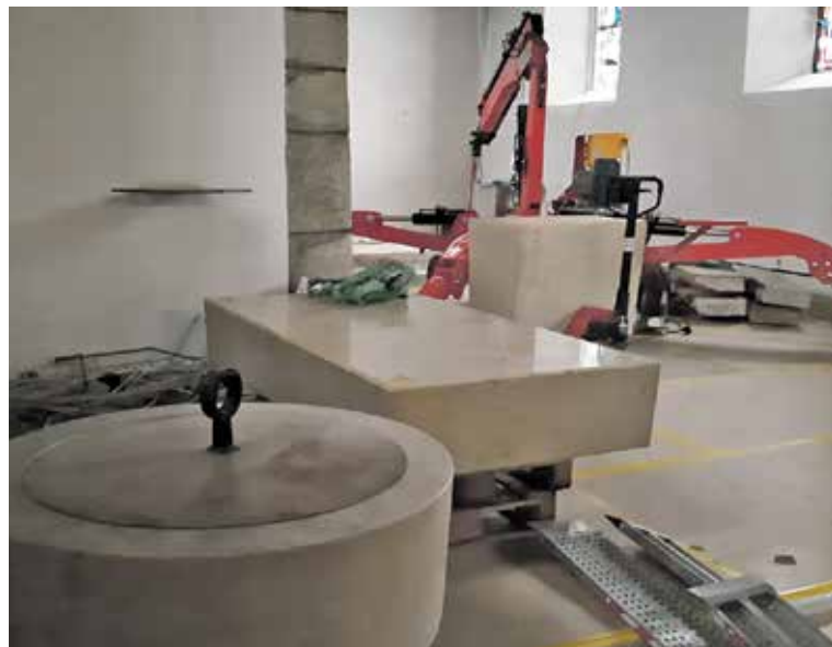
Wir bauen um – sowohl in Pfeffingen als auch im Seelsorgeverband. Umbauen heisst auch loslassen, damit neu Schönes entstehen kann.