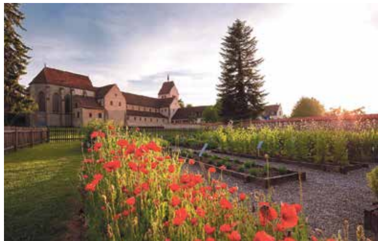
Unesco-Welterbe Klosterinsel Reichenau.