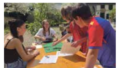
Am Minitag hiess es im Casino «All in».

Die Ministranten und Ministrantinnen der Pfarrei Arlesheim luden am Samstag, 13. April, zu einem kantonalen Spielenachmittag in den Domhof ein. Bei