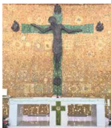
Pfarramt Pio X

7.30 STA Eucharistiefeier (Kapelle) 18.00 STA Beichtgelegenheit 19.00 STA Eucharistiefeier 18.30 Pio X S. Messa