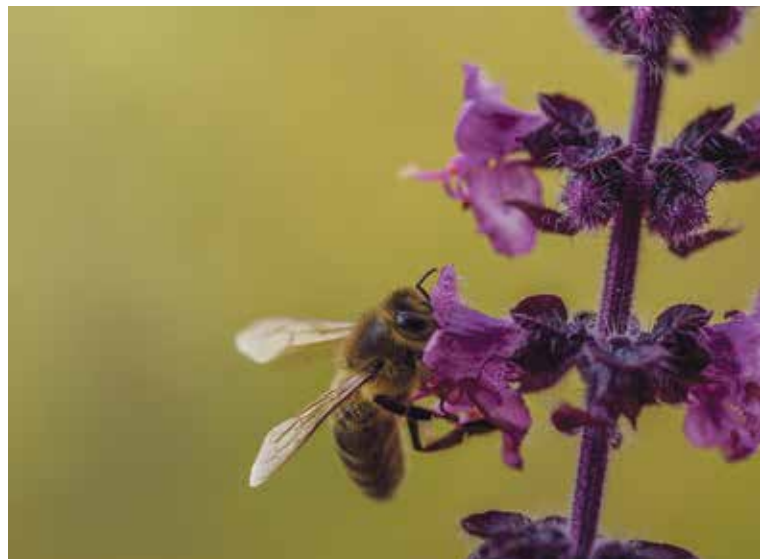
Blüte mit Hummel.