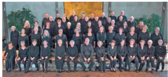
Der Chor St. Franziskus.