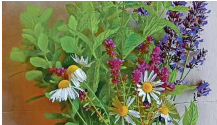
Kräutersegnung während der Messe am 13. August um 9 Uhr. Bitte legen Sie Ihre Blumen und Kräuter vor der Messe beim Ambo hin.