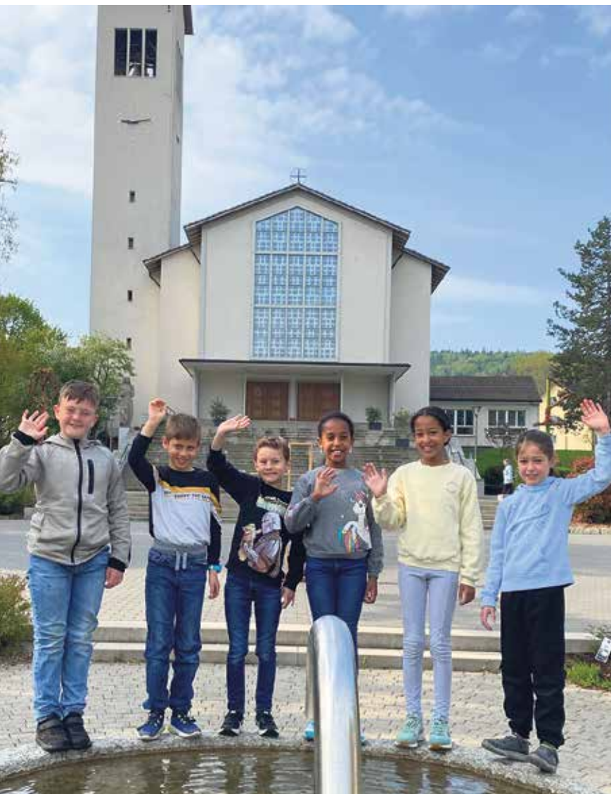
Erstkommunionkinder 2022 winken auf dem Pfarreibrunnen-Rand ...