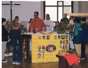
Gottesdienst am Palmsonntag.