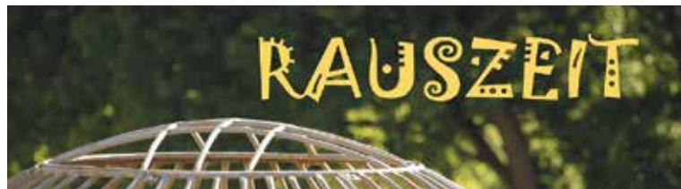
Pfarrei Bruder Klaus Liestal