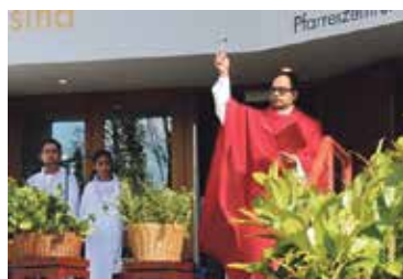
Palmsonntag – Segnung der Palmen.