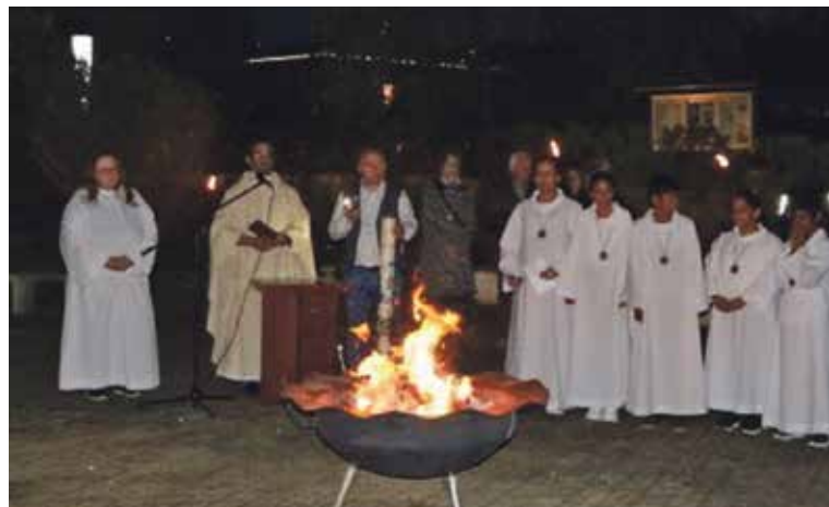
Osternacht in Dreikönig: Start beim Osterfeuer auf dem Vorplatz der Kirche.