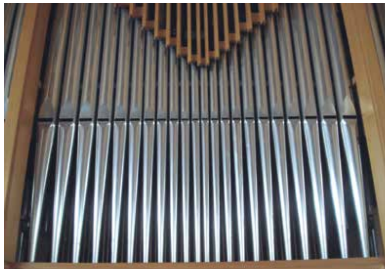
Die Königin der Instrumente.