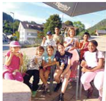
Die Verpflegung stimmte ...