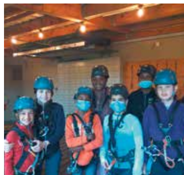
Die Ausrüstung stimmte ...