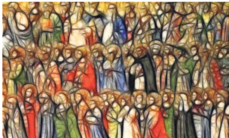
Die himmlischen Heerscharen – Heilige und Verstorbene vor Gott.