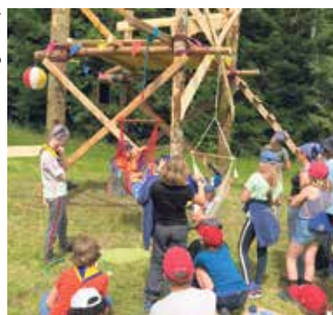
Die Pfadigruppe Blauenstein vor einem Holzturm.