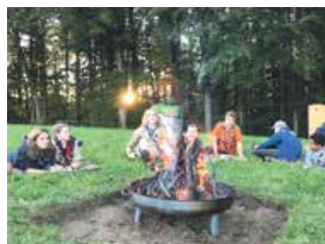
Pfadis St. Alban beim gemütlichen Beisammensein um das Lagerfeuer.