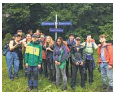
Gruppenfoto der Piostufe Blauenstein vor dem «Blauenstein»-Wegweiser.