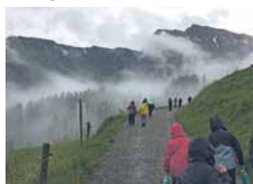
Die Blauensteiner Wölfe auf einer Nebelwanderung.