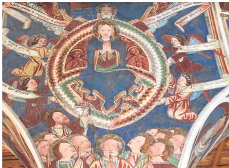
Mariä Himmelfahrt: Wandbild in der Kirche San Carlo di Negrentino.