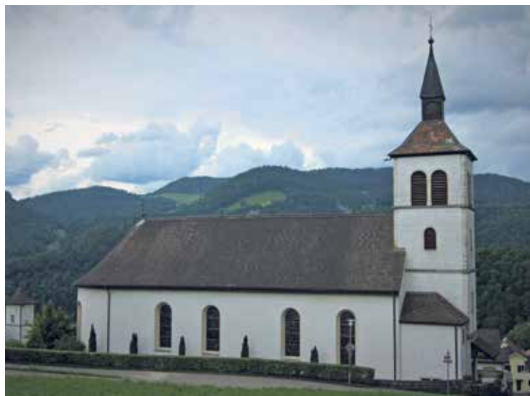
Pfarrkirche St. Peter und Paul, Liesberg Dorf.

Der Weg zurück nach Liesberg führt dem gepflasterten Stutzweg entlang, vorbei am Rast- und Kinderspielplatz Grundköppli (nach rund einer Viertelstunde Gehzeit auf der rechten Seite). Nach weiteren zehn Gehminuten finden wir am Ortseingang ein letztes