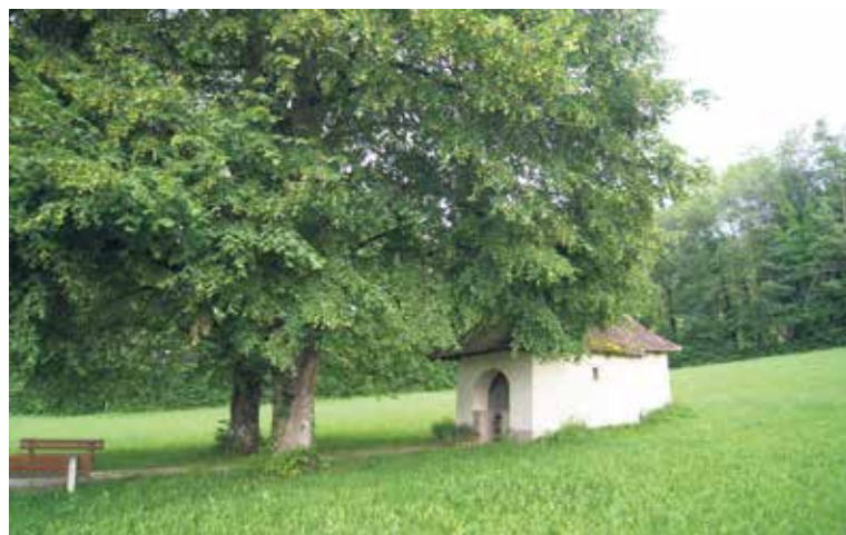
Unter Linden: Wegkapelle Albach.