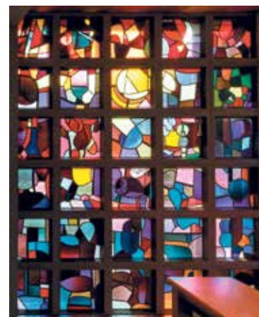
Glasfenster von Hans Stocker in der Kapelle Oberrütti.