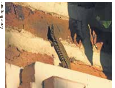
Endlich Sonne tanken!