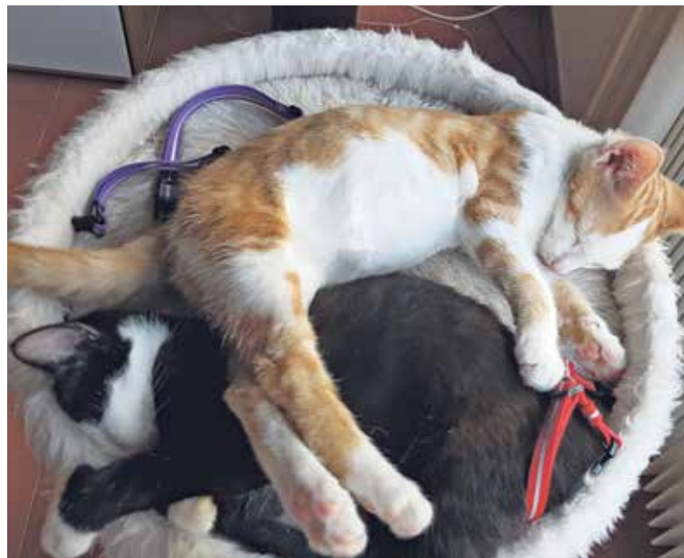
Die Ruhe vor dem Sturm...