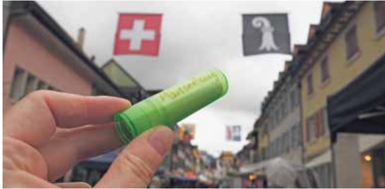
Am ersten Dienstag im Juli war wieder Märtseelsorgezeit. Das ökumenische Team der drei Landeskirchen war mittlerweile zum vierten Mal am Warenmarkt in Laufen mit eigenem Stand präsent. Als Bhaltis gab es diesmal Lippenpomade.