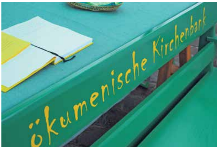
Bewährt hat sich neben den Bhaltis und dem Fürbittbuch die ökumenische Kirchenbank, die je nach Wetter in den Sonnen-, Wind- oder Regenschatten wandern kann.