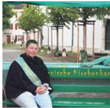
Ob langes Gespräch auf der ökumenischen Kirchenbank oder ein fröhliches Winken aus der Ferne: die Seelsorgenden sind da und offen und freuen sich über alle, die an den Stand kommen.