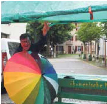
Das Team hat mittlerweile verschiedene Wetterlagen am Märt erlebt. Nass trifft es für den vergangenen Märttag am besten. Der Laune tat das weder bei unseren Besucherinnen und Besuchern, noch beim Team einen Abbruch.