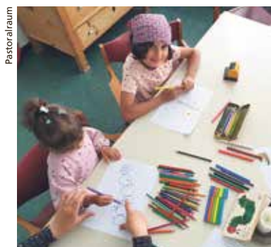
Spass am Vorlesestag.

27. Oktober und 24. November Für die Vorlesegruppe Eveline Beroud