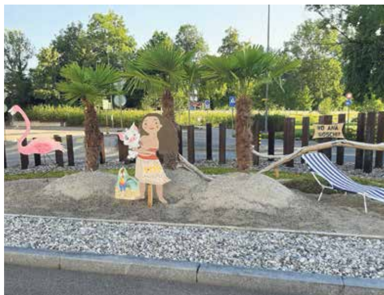
Ferienstimmung im Kreisel in Allschwil.