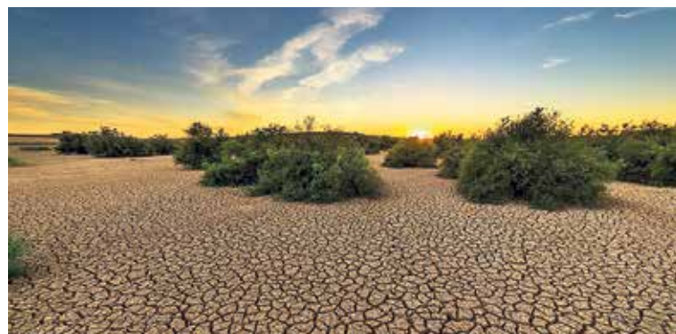
Wie oft haben Sie heiligen Boden betreten?

Ehe- und Partnerschaftsberatung Hofackerstrasse 3, 4132 Muttenz Tel. 061 462 17 10 www.paarberatung-kathbl.ch info@paarberatungkathbl.ch