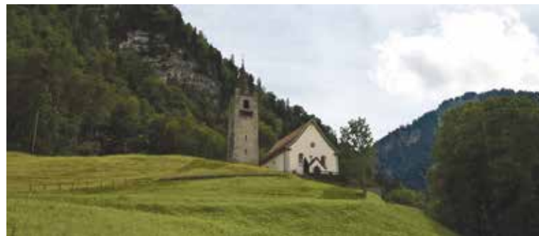
Kapelle St. Niklausen, Kerns.