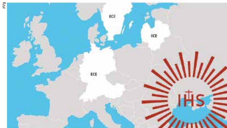
Deutschland, Österreich, die Schweiz und Litauen bilden mit Schweden und Lettland die Zentraleuropäische Provinz.

logie. Die Delegaten helfen, koordiniert voranzugehen und auf lokale Herausforderungen zu reagieren. Mit den Mitarbeitenden in den Werken werden die Jesuiten über Ländergrenzen hinweg zusammenwirken, ohne dass die lokalen Charakteristika verloren gehen. Vielmehr ist die neue Provinz eine Chance, Kirche nicht nur für das eigene Land, sondern im Dienst aller Menschen zu leben, so wie das der Papst in seiner jüngsten Enzyklika Fratelli tutti allen ans Herzen legt.