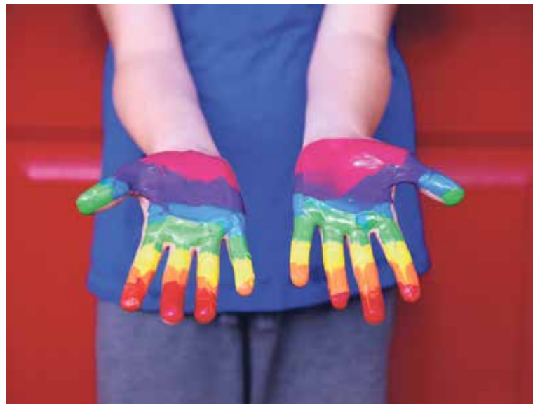
Vielfalt – Zeichen einer lebendigen Kirche.