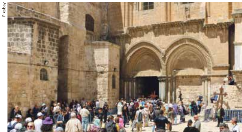
Grabeskirche in Jerusalem.