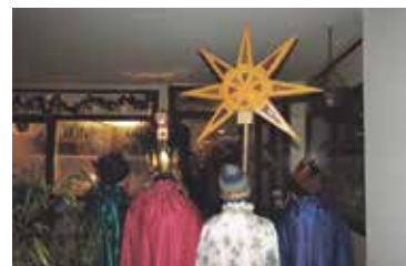
Sternsinger unterwegs in Aesch.

Die Kinder haben geübt und sind traurig. Aber im Hinblick auf die Sicherheit aller haben wir uns mit schwerem Herzen entschieden, die Besuche des Sternsingers vom 5. und 6. Januar 2021 in Aesch, Pfeffingen und Duggingen nicht durchzuführen. Sie können sich bei uns