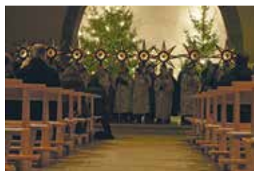
Aussendungsfeier 2020 in Pfeffingen.