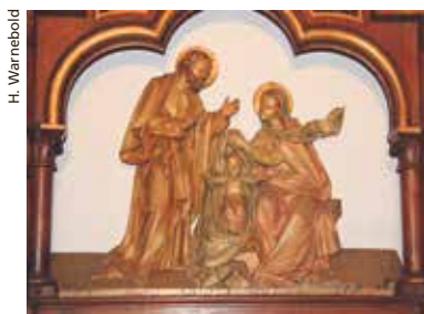
Krippendarstellung aus der Oberwiler Kirche vor der Renovation.

Liebe Pfarreiangehörige An dieser ausserordentlichen Weihnacht müssen wir weiterhin die Gottesdienstbesucherzahl auf 50 beschränken. Es braucht keine Anmeldung, jedoch bitten wir um Verständnis, dass