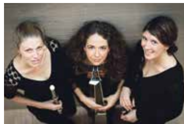
Trio l'Art du Bois

in der Kirche Sankt Franz Xaver, Münchenstein statt. Die wunderschön gestaltete renovierte Kirche ist besonders einladend in dieser Zeit, um bei Kerzenschein zu verweilen, bei musikalisch anspruchsvoll gestaltetem Konzertprogramm. Renommierete Künstlerinnen und Künstler aus Basel sowie aus dem Ausland spielen und singen aus dem grossen Musikrepertoire für die Zeit um Advent und Weihnachten.