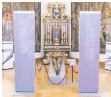
Souveräner Malteser-Ritter-Orden (A)