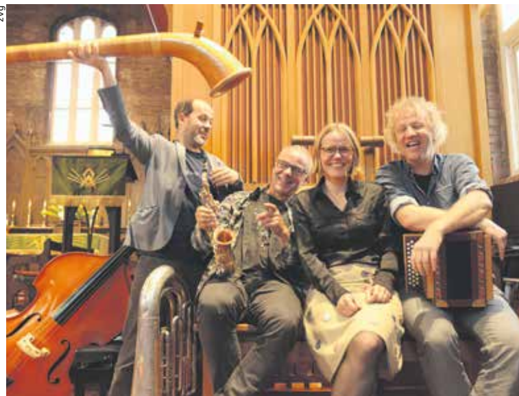
Die Gruppe Sulp.