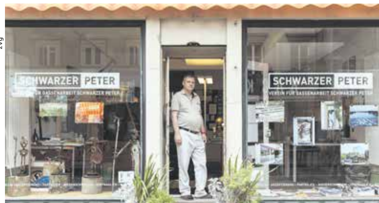
Eine Ausstellung auf dem Claraplatz von kunstschaaffenden Klienten und Klientinnen des Schwarzen Peters.

Die Angaben für sämtliche Pfarreien des Pastoralraums Basel-Stadt finden Sie auf den Seiten 6 und 7.