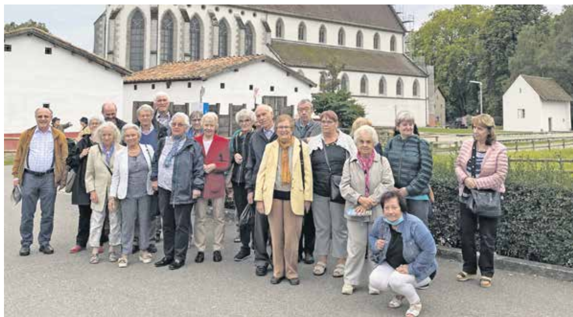
Eine fröhliche Reisegruppe vor der Klosterkirche Königsfelden in Windisch.