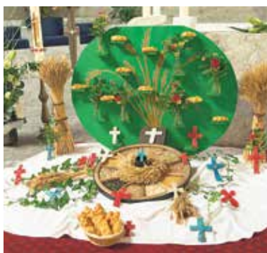
Jesus begegnen in der heiligen Kommunion.