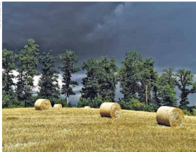
Die Ernte ist (fast) im Trockenem.