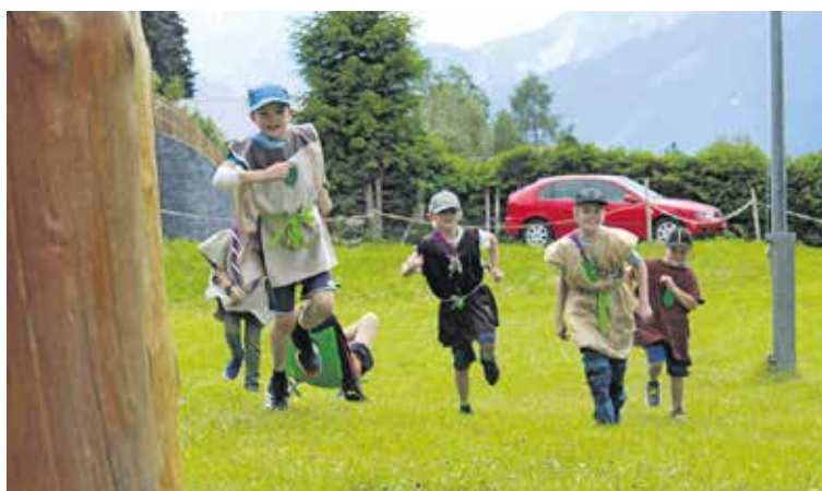
Das Wolfsommerlager der Pfadi.