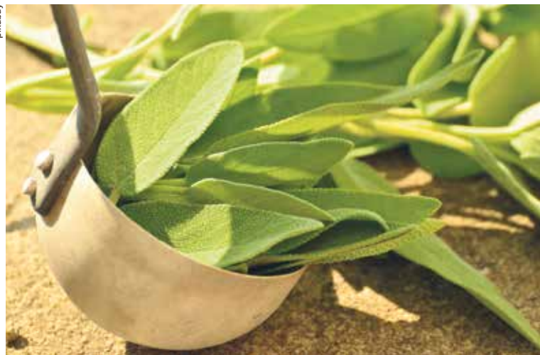
Sommerliches Wundermittel Salbei.