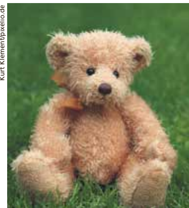
Haben Sie ihn auch noch, den Tröster aus der Kinderzeit?

Spenden setzen sie nur für Aufgaben ein, die nicht durch Kostenträger gedeckt sind, sowie für Notsituationen. Zu diesen Aufgaben zählen z.B. Case Management und Trauerbegleitung. Danke für Ihre Unterstützung.