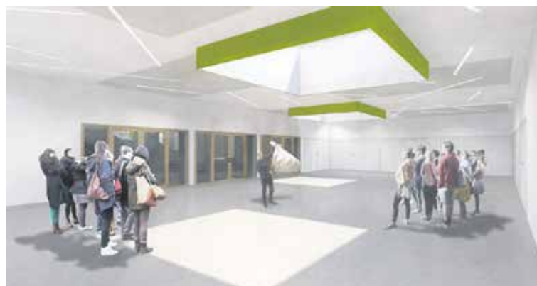
So wird der Saal im Untergeschoss des Begegnungszentrums aussehen.

Ökumenisch, quaterverbunden und multifunktional – das sind die Attribute des Projekts «Begegnungszentrum Hirzbrunnen», für dessen Umsetzung anlässlich der 157. Synode der Römisch-Katholischen Kirche Basel-Stadt ein Baukredit von rund 1,8 Millionen Franken gesprochen wurde. Die Visualisierungen auf dieser Seite zeigen eindrücklich, dass sich die zukünftigen Nutzerinnen und Nutzer freuen dürfen. Der Entscheid für den erwähnten Baukredit war umstritten und fand in der Synode nur knapp das erforderliche Mehr. Das neue Projekt, für das neben der Pfarrei St. Clara und der Kroatischen Mission in der benachbarten St. Michaelskirche auch die Evangelisch-reformierte Kirche sowie diverse Genossenschaften und Quartiervertreter einbezogen wurden, soll nach dem Willen einer Mehrheit der Synode sofort umgesetzt werden können. Ausführliche Informationen dazu im Bericht von der Synode auf Seite 3 in dieser Ausgabe von «Kirche heute» und auf www.kirche-heute.ch sowie auf www.rkk-bs.ch im Verzeichnis Kantonalkirche/Synode.