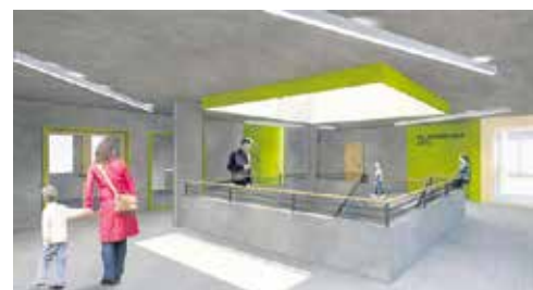
Das Foyer im Erdgeschoss.

Visualisierungen: beck + oser architekten eth sia gmbh