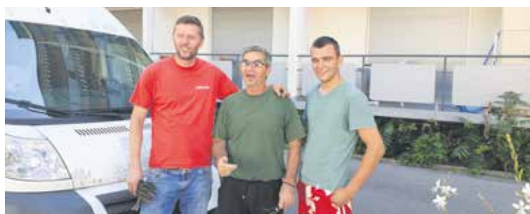
Die drei Chauffeure, die den Transport sicher ans Ziel brachten.