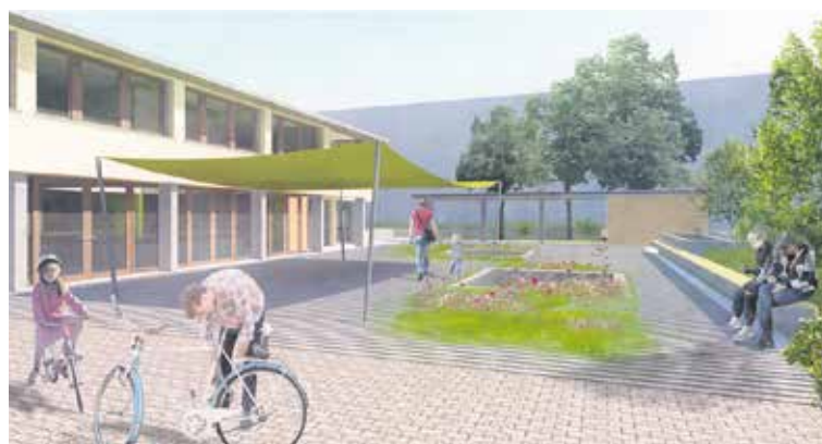
Der zukünftige Vorplatz des Begegnungszentrums Hirzbrunnen.

Visualisierungen: beck + oser architekten eth sia gmbh