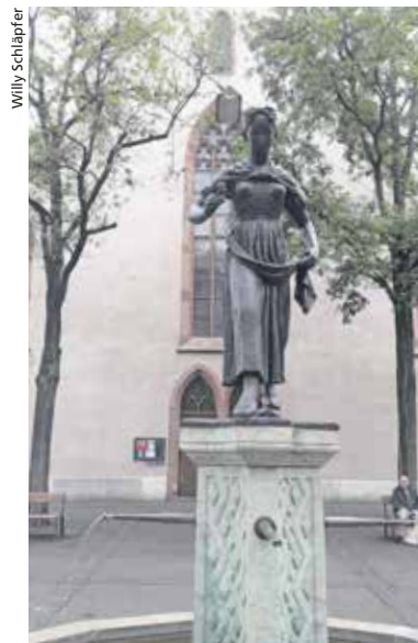
«Vrenelibrunne», Claraplatz, 4058 Basel, gestiftet von den Kindern aus Baden-Württemberg als Dank für die Hilfe, die die Stadt Basel nach dem 2. Weltkrieg geleistet hat.

Die hl. Verena hatte die Macht, die physischen Gesetze aufzuheben. Sie ist von