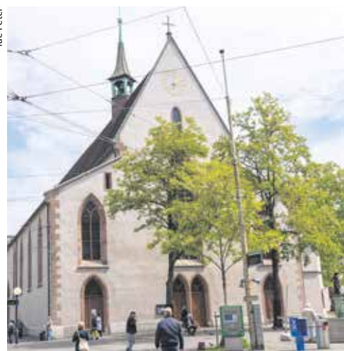
Kirche St. Clara.