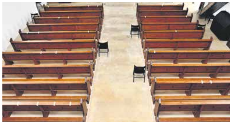
Helle Markierungen und zusätzliche Stühle gewährleisteten 54 Sitzplätze im Abstand von 2 Metern.