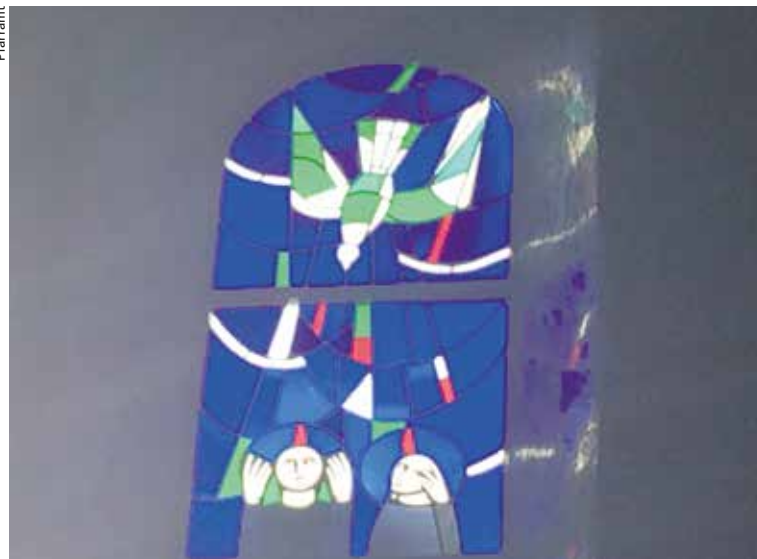
Pfingstfenster von Jacques Düblin im Chorraum der Kirche St. Peter und Paul Oberwil.