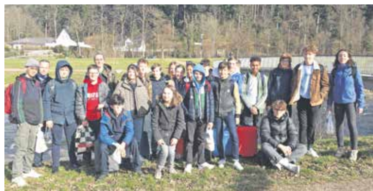
Die Firmlinge der Pfarrei waren in Freiburg im Firmweekend.

Ab 19.30 Uhr: Gesprächsmöglichkeit mit Seelsorgenden