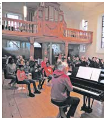
Weltgebetstag am 6. März um 15.00 Uhr in der reformierten Dorfkirche Kleinhüningen.