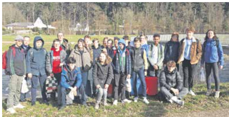
Die Firmlinge der Pfarrei waren in Freiburg im Firmweekend.

Ab 19.30 Uhr: Gesprächsmöglichkeit mit Seelsorgenden