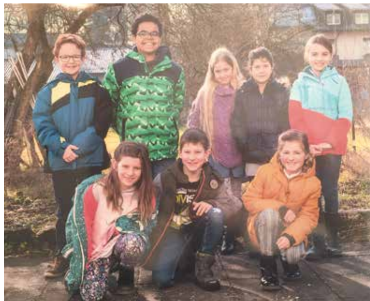
Erstkommunionkinder 2020 aus unserem Verband.