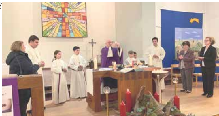
Ministri straordinari della Comunione.