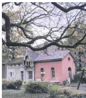
Ideal zum Spielen: Der Innenhof der Marienkirche mit dem alten Häuschen.

Mit einem neuen Kindertreff möchten wir das Angebot für die jungen Gemeindemitglieder weiter ausbauen. Gemeinschaft erleben