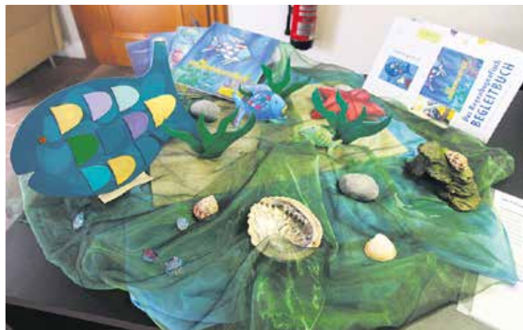
Materialkoffer zum Bilderbuch Regenbogenfisch.

Die Ökumenische Medienverleihstelle, die religions- und medienpädagogische Fachbibliothek und Mediathek beider Basel, stellt ein breites und ansprechendes Angebot an Büchern und Zeitschriften, CDs, DVDs, Postern, Anschauungs- und Legematerial, Themenkoffern, Spielen und Materialien