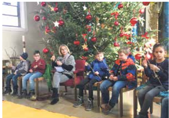
Erstkommunion Brotbacknach- mittag.