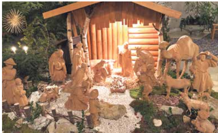
Die von Patrick Henz gestaltete und geschmückte Krippe in der Kirche St. Lukas.