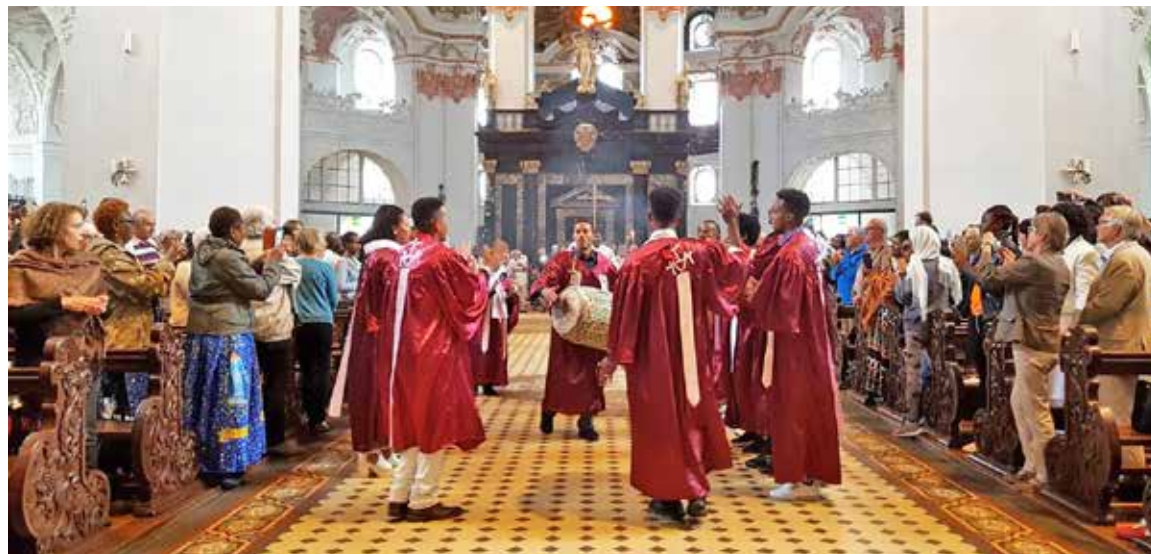
Afrikanische Trommelmusik begleitet den Gottesdienst.