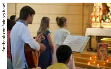
Lobpreisabend in der Kirche St. Joseph.

Nach dem Impuls wird das Allerheiligste ausgesetzt für die eucharistische Anbetung. Nach dem Singen und Zuhören folgt eine kurze Zeit der Stille. Die Stille, die besonders wichtig ist in unserem