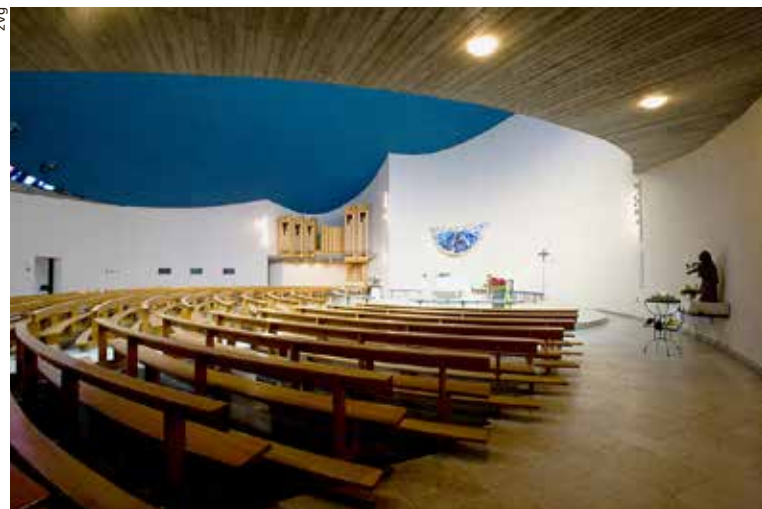
An jedem ersten Donnerstag im Monat findet in der Bruder-Klaus-Kirche das ökumenische Morgengebet statt.