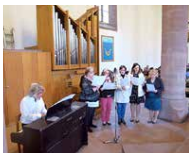
Erwachsenenchor St. Joseph.