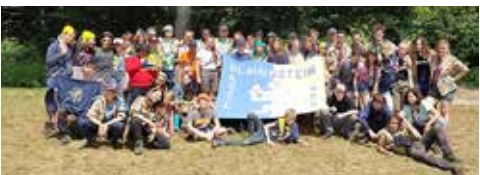
Die Pfadis und Pios Blauenstein auf ihrem Lagerplatz in Schaffhausen.

Die Blauensteiner Pfadis waren in Schaffhausen beim Zirkus «Bimsalassim» auf Besuch. Sie halfen dem Zirkus wieder auf die Beine, indem sie herausfanden, dass die Artisten von Schemen besessen waren und deshalb der Zirkus vom Aussterben bedroht war.