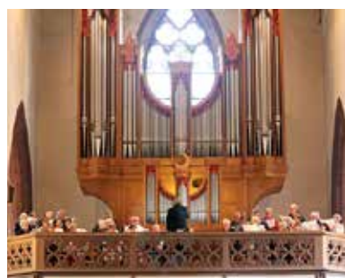
Kirchenchor St. Clara.