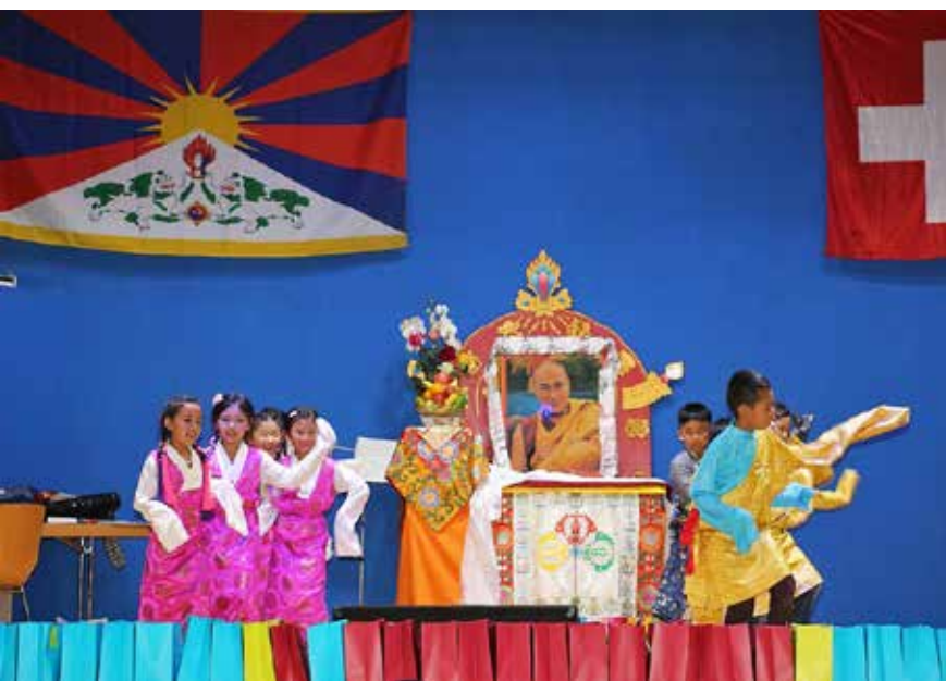
Tibetfest Basel vom 9. bis 11. August am Lindenberg. Von Freitag, 9. August ab 17.00 Uhr bis Sonntag, 11. August, um 17.00 Uhr findet am Lindenberg das Tibetfest statt. In Basel und Umgebung haben über 700 Tibeter und Tiberinnen eine neue Heimat gefunden. Die Tibeter-Gemeinschaft wurde vor über 30 Jahren gegründet. Der Tibeter-Gemeinschaft ist es ein Anliegen, die Festbesucher mit Kulturellem sowie Kulinarischem aus Tibet zu verwöhnen. Weitere Informationen: www.tibetswiss.ch . Das Foto zeigt eine tibetische Kindertanzgruppe.