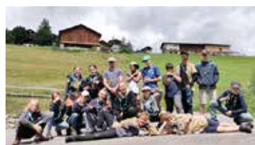
Die Pfadistufe der Pfadi St. Alban kurz vor der Rückreise.

Speziell war das Lager für sie, weil es bei Disentis GR in den Alpen stattfand und sie dadurch eine Extraportion Berge und Natur geniessen konnten, bei Sonnenaufgangswanderung und Biwak, Abkochen und Hike.