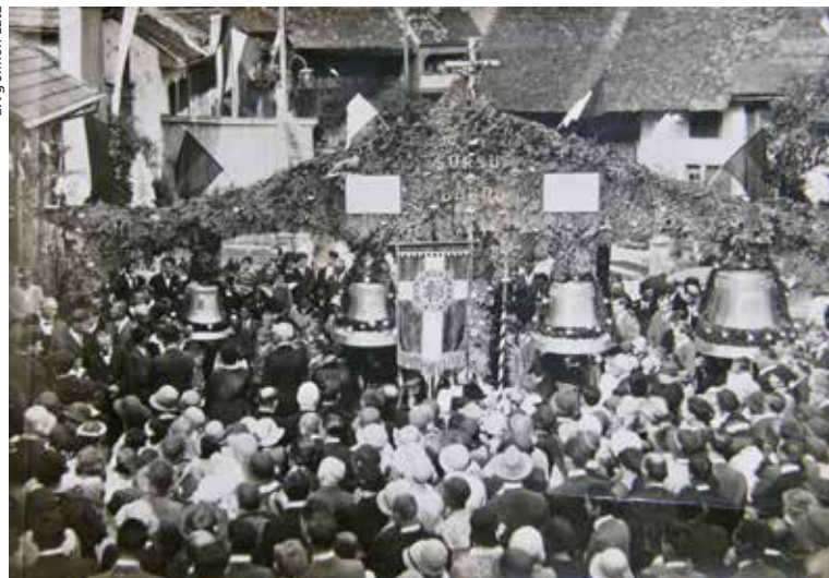
Am 14. Juni läuten die Glocken für die Frauen (Glockenweihe 1932).