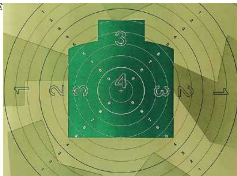
Feldgottesdienst am Feldschieszen.