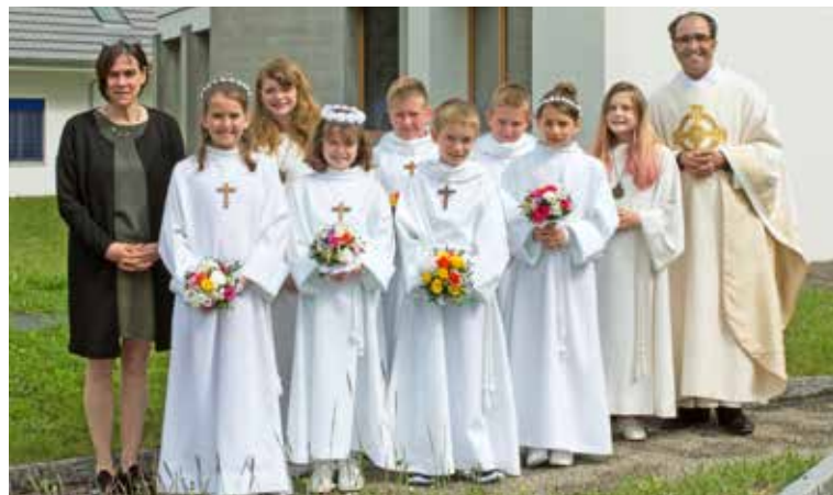
Erstkommunikanten von Fehren.