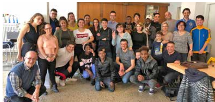
Gruppo senza frontiere.

Am Samstag, 30. März, fand das Treffen mit Jugendlichen statt. Der Anlass wurde durch die Gruppe «Senza frontiere» organisiert. Ein Dutzend Junge wurden mit guter Laune und Begeisterung empfangen.