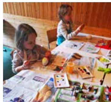
Impressionen vom Ostereierbmalen am Kindernachmittag.