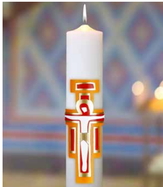
Hongler Kerzen Altstätten