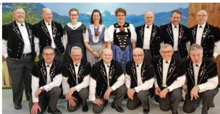
Jodlerclub Echo Basel.

Der Jodlerclub Echo Basel lädt zum Kirchenkonzert am Samstag, 27. April, um 20.00 Uhr in die Kirche St. Clara ein. Es wirken mit: Jodlerclub Echo Basel,