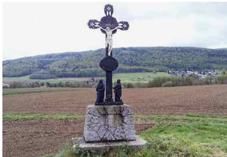
Kreuz auf dem Weg von Rodersdorf nach Liebenschwiller.