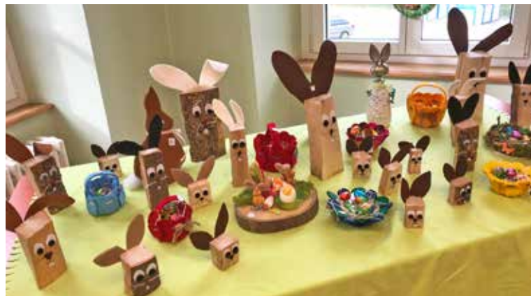
Bastelarbeiten der Juniorbastelgruppe von 2018.