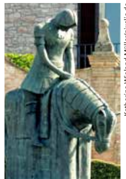
Franziskus von Assisi.