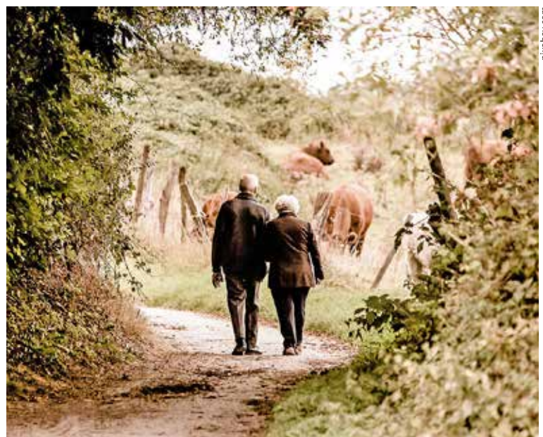
Zu einem Leben in Fülle gehören auch Beziehungen.