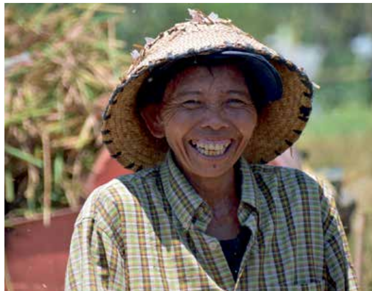
Verbunden mit der Erde – bereit für den Wandel.