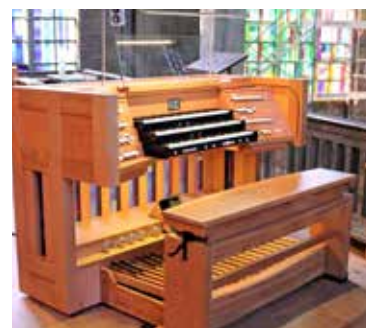
Der neue Spieltisch.

Die grossen Aufwendungen und Leistungen in jener Zeit sowie die Einheit in der Gestaltung von Kirchenraum und Orgel sollte eine starke Verpflichtung sein, das Instrument entsprechend seiner Eigenart zu nutzen, zu hören und zu bewahren! Über die verschiedenen Massnahmen, die im Rahmen unserer bereits im März 2018 begonnenen Orgelrevision erfolgt sind, informiert der Artikel von Meinrad Stöcklin in dieser