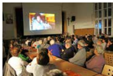
Beiträge aus Rumänien bereichern die Vorstellung des Projektes.