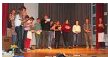
Musikalische Begrüssung am Samstag, es singen die Jugendlichen der Firmungsvorbereitung mit Helfern und Helferinnen des Fests.