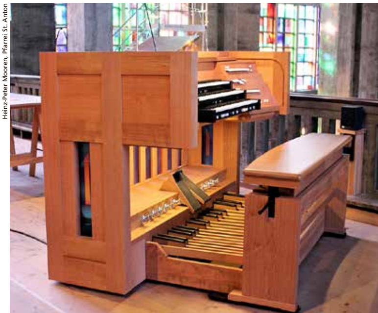
Der neue Spieltisch der Orgel in St. Anton.