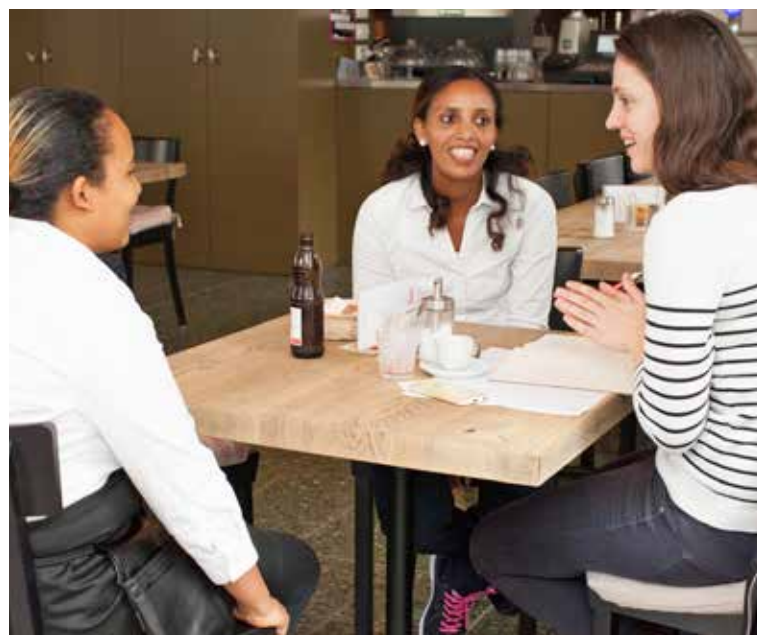
Zeit für ein Gespräch bleibt immer.

Servierpersonal freut sich auf Ihren Besuch. Übrigens, die Lokalitäten können auch für private Veranstaltungen gemietet werden.