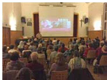
Kino am Freitagabend.