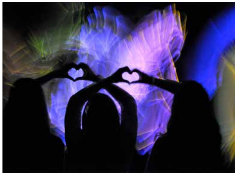
Gott hat ein Herz für uns Menschen.