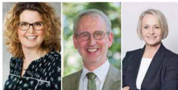
Ztg. Ökum., Kirche Flüh