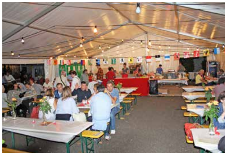
Abendstimmung im Antoniuszelt.