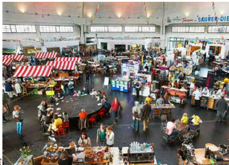
Der Marktplatz 55+ findet in der Markthalle statt.