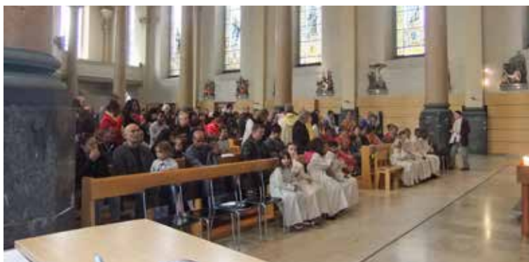
Gemeinsamer Familiengottesdienst um 10.30 Uhr am Josepfsfest 2015.