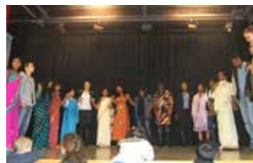
Begegnung im Pfarreisaal am Tag der Völker im November 2014.