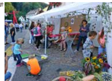
Stand der Pfarrei.