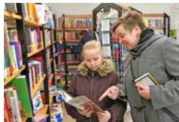
Freude am Lesen.

Am Dienstag, 25. September, um 19.15 Uhr gestaltet das Frauenforum St. Michael einen Abendgottesdienst, zu dem auch die Männer herzlich eingeladen sind. Anschliessend sind alle Gottesdienstbesuchende zum Bettmüpfeli im Käffeli herzlich eingeladen.