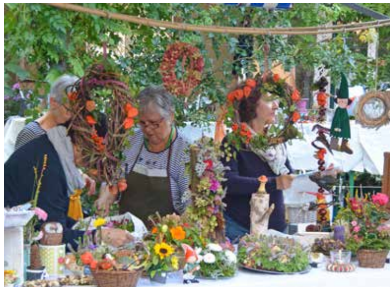
Bunte Vielfalt am Herbstmärt.