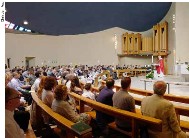
Die sehr gut besetzte Kirche Bruder Klaus während eines Gottesdienstes der ESRCCB.