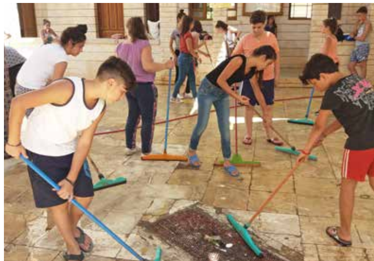
Putzen des Pfarreizentrums, wo wöchentlich 1000 Kinder und Jugendliche sich treffen, wo 400 Familien Unterstützung für ihr tägliches Leben bekommen ...