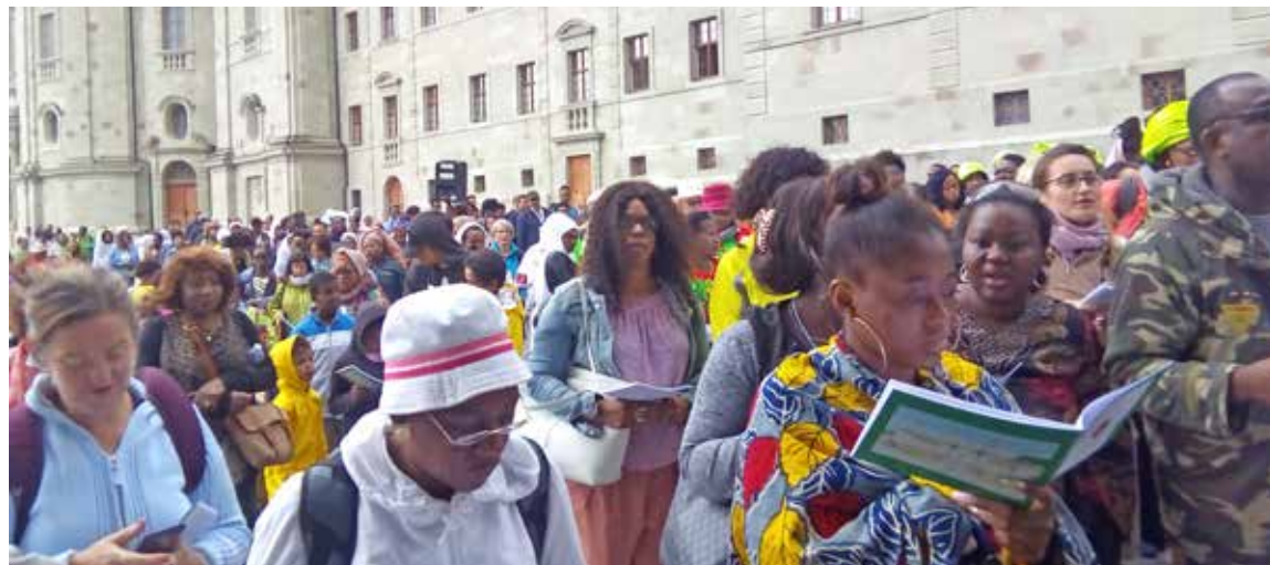
Alle Interessierten, unabhängig der Herkunft, waren zur afrikanischen Wallfahrt nach Einsiedeln eingeladen.