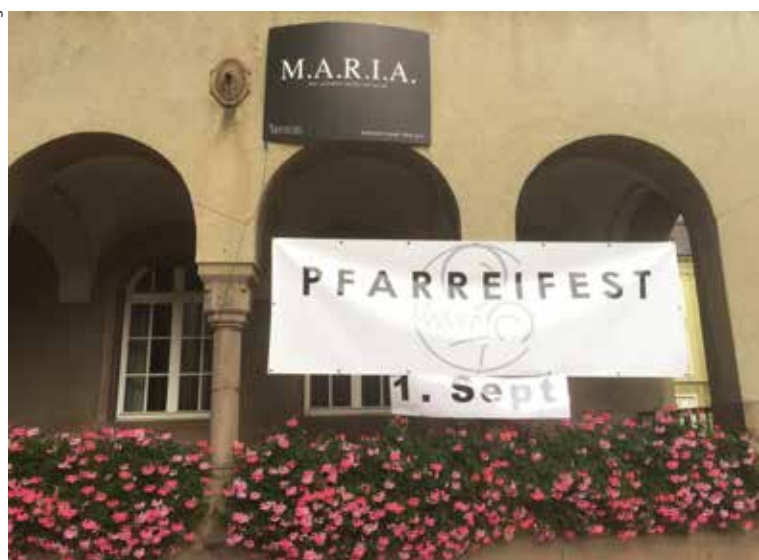
Wir freuen uns, Sie am 1. September ab 12.00 Uhr am Pfarrefest St. Marien begrüßen zu dürfen.