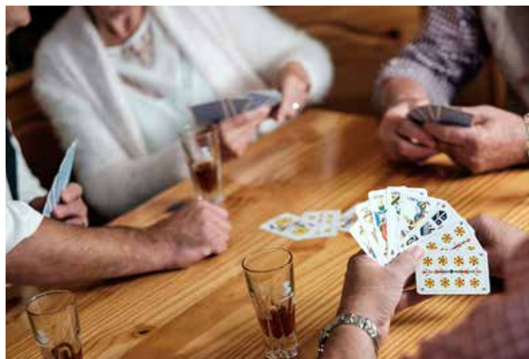
Wer wird wohl dieses Mal der Jasskönig sein?

Am Freitag, 7. September, wird im Pavillon bei der Dorfkirche in Kleinhüningen ab 19.30 Uhr gejast. Es sind aber auch Nichtjasser zum gemütlichen Beisammensein herzlich willkommen.