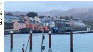
Die Hafenstadt Dingle an der Westküste Irlands.