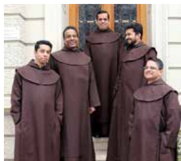
Die Gemeinschaft versammelt vor dem Kloster.