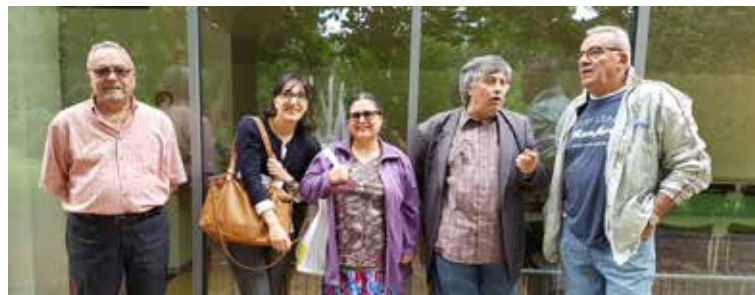
Unsere Grillhelden im Kannenfeldpark.