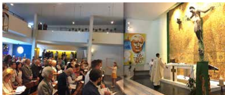
Dankgottesdienst in S. Pio X.

Am Sonntag, 24. Juni, nahmen wir zusammen am Dankgottesdienst teil. Nach der Zeremonie ging es im Pfarreisaal mit einem durch den Pfarreirat organisierten Apéro riche weiter. Musika-